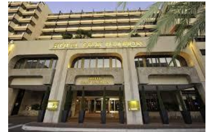
Cannes – Gray d'Albion