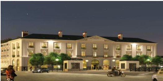
Nantes – Carré Lafayette