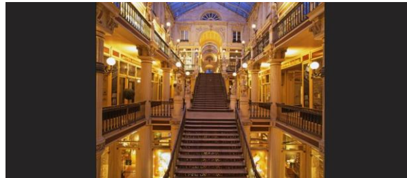
Nantes – Passage Pommeraye